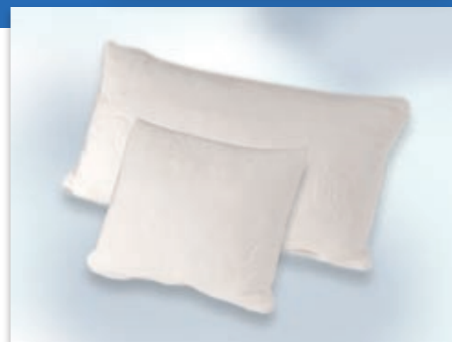
KOPF- UND LAGERUNGSKISSEN